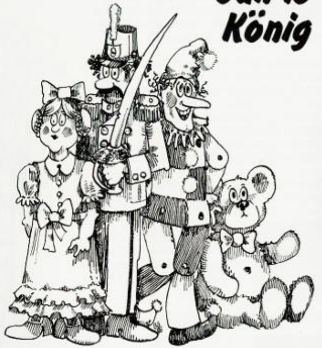
En lüttjet Wiehnachtsspill vun August Hinrichs