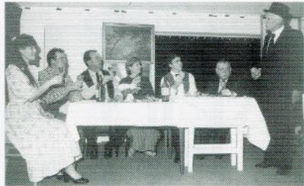
Das „Leben in de Bood“ Ensemble wünscht einen angenehmen Theaterabend.

„Leben in de Bood“ wurde nach dem Krieg ab April 1950 insgesamt 16 mal von der nbr im Stadttheater Rendsburg und in umliegenden Gemeinden gespielt.